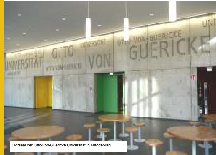
Hörsaal der Otto-von-Guericke Universität in Magdeburg

Wir unterstützen und fördern unsere Mitarbeiter in ihrer persönlichen und beruflichen Entwicklung.