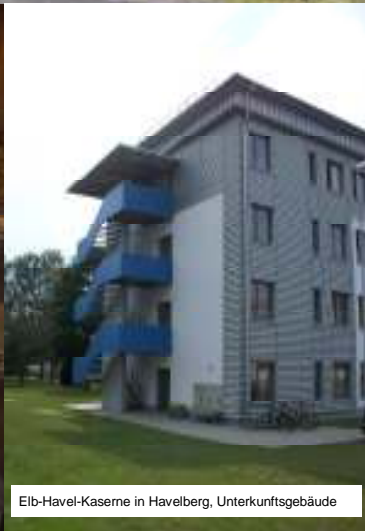
Eib-Havel-Kaserne in Havelberg, Unterakunftsgebäude