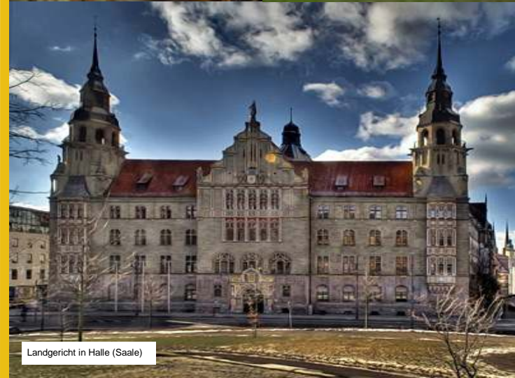
Landgericht in Halle (Saale)