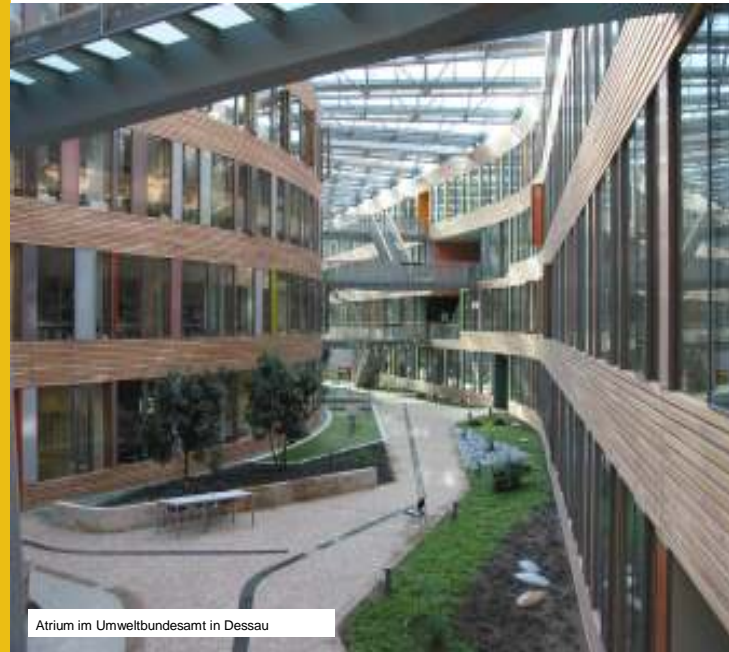
Atrium im Umweltbundesamt in Dessau