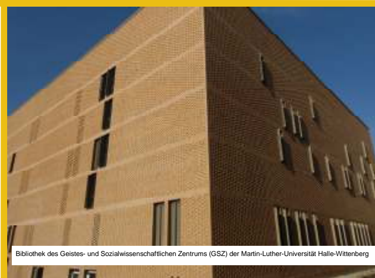
Bibliothek des Geistes- und Sozialwissenschaftlichen Zentrums (GSZ) der Martin-Luther-Universität Halle-Wittenberg

Wir sind der größte Immobiliendienstleister des Landes Sachsen-Anhalt, der die Landesimmobilien im gesamten Lebenszyklus bewirtschaftet und für deren Vermögenserhaltung bzw. Vermögensentwicklung verantwortlich ist.