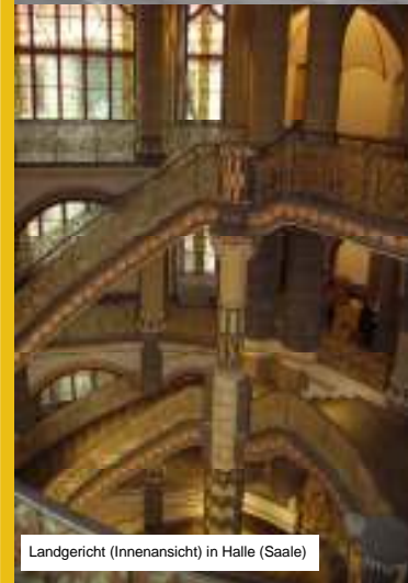
Landgericht (Innenansicht) in Halle (Saale)